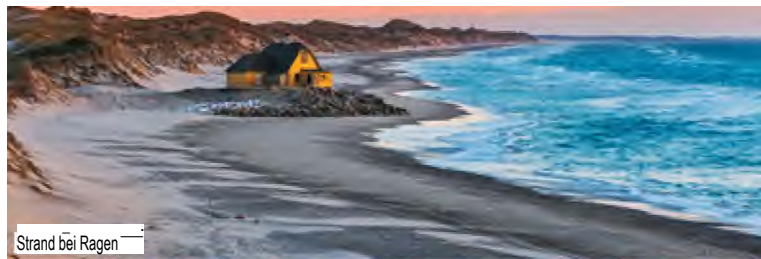
Strand bei Ragen